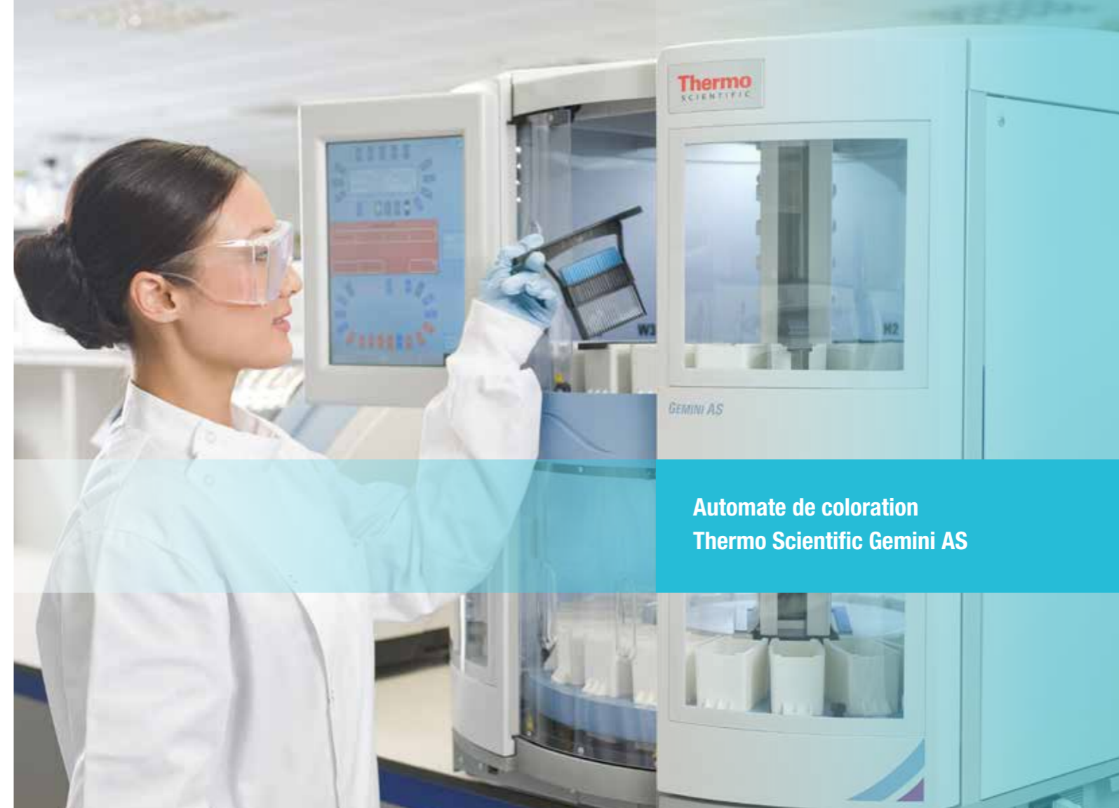
Automate de coloration Thermo Scientific Gemini AS